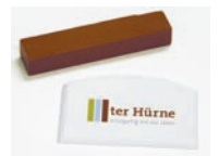
Art.-Nr.: je nach Dekor Inhalt: Wachsstange mit Spachtel

Beschädigungen, die durch starke Einwirkungen die Oberfläche sichtbar in Mitleidenschaft gezogen haben, können mit der farblich abgestimmten Reparaturwachsstange aus dem ter Hürne Sortiment aufgearbeitet werden.