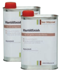
Art.-Nr.: 44125 Natur Inhalt: 250 ml Art.-Nr.: 44126 Weiß Inhalt: 250 ml

Farbige Reparaturwachsstangen arbeiten unschöne Stellen wieder auf.