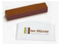
Art.-Nr.: je nach Dekor Inhalt: Wachsstange mit Spachtel

Beschädigungen, die durch starke Einwirkungen die Oberfläche sichtbar in Mitleidenschaft gezogen haben, können mit der farblich abgestimmten Reparaturwachsstange aus dem ter Hürne Sortiment aufgearbeitet werden.